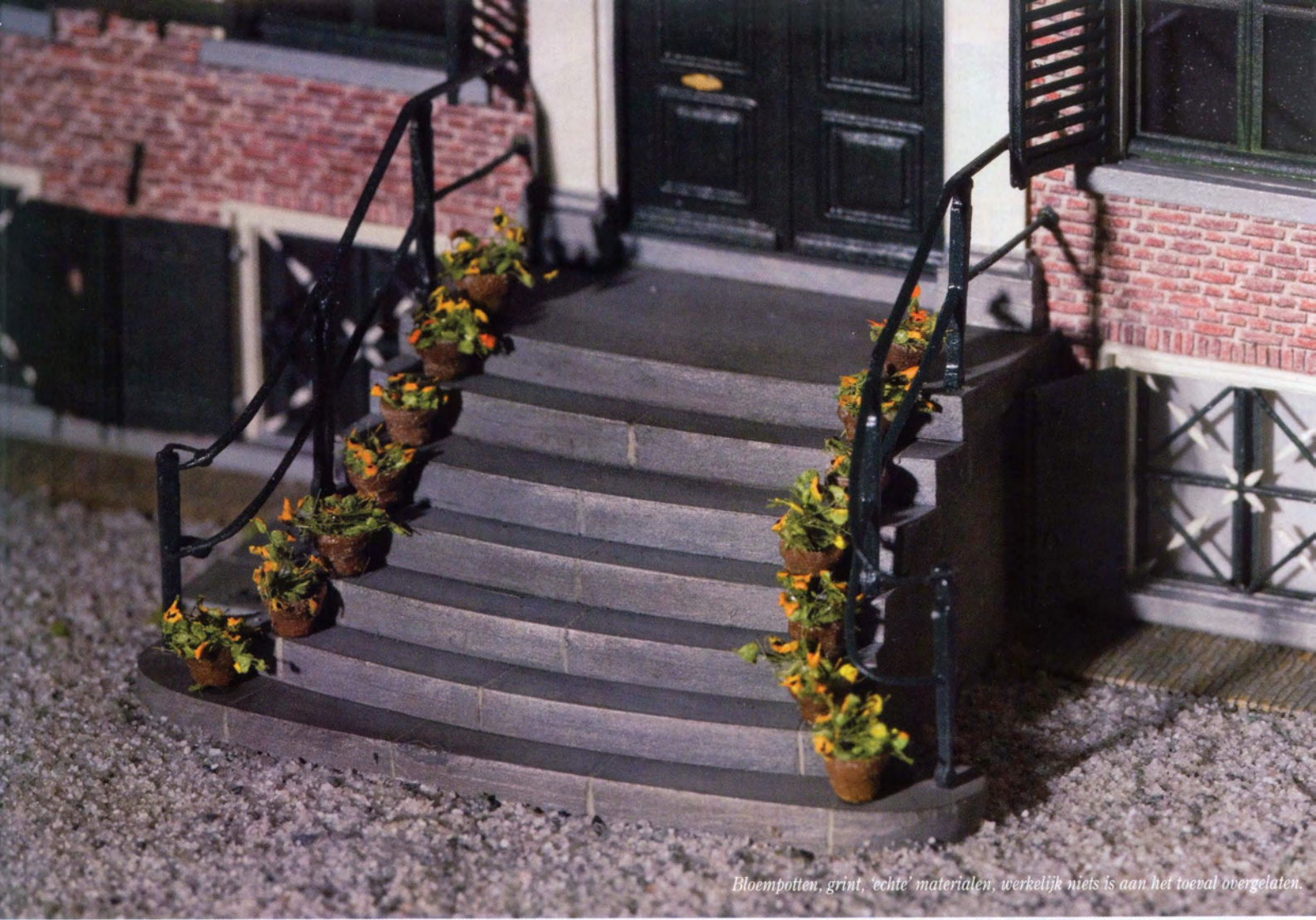
Bloempotten, grint, 'echte' materialen, werkelijk niets is aan het toeval overgelaten.