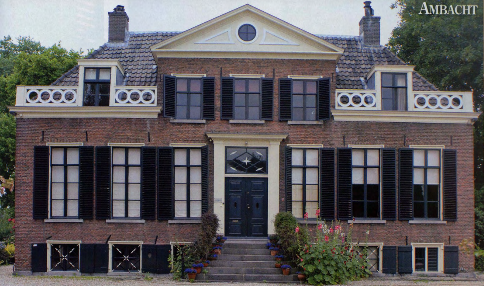
Huize Vreeden Hoef', in al zijn monumentale schoonheid, in het echt.