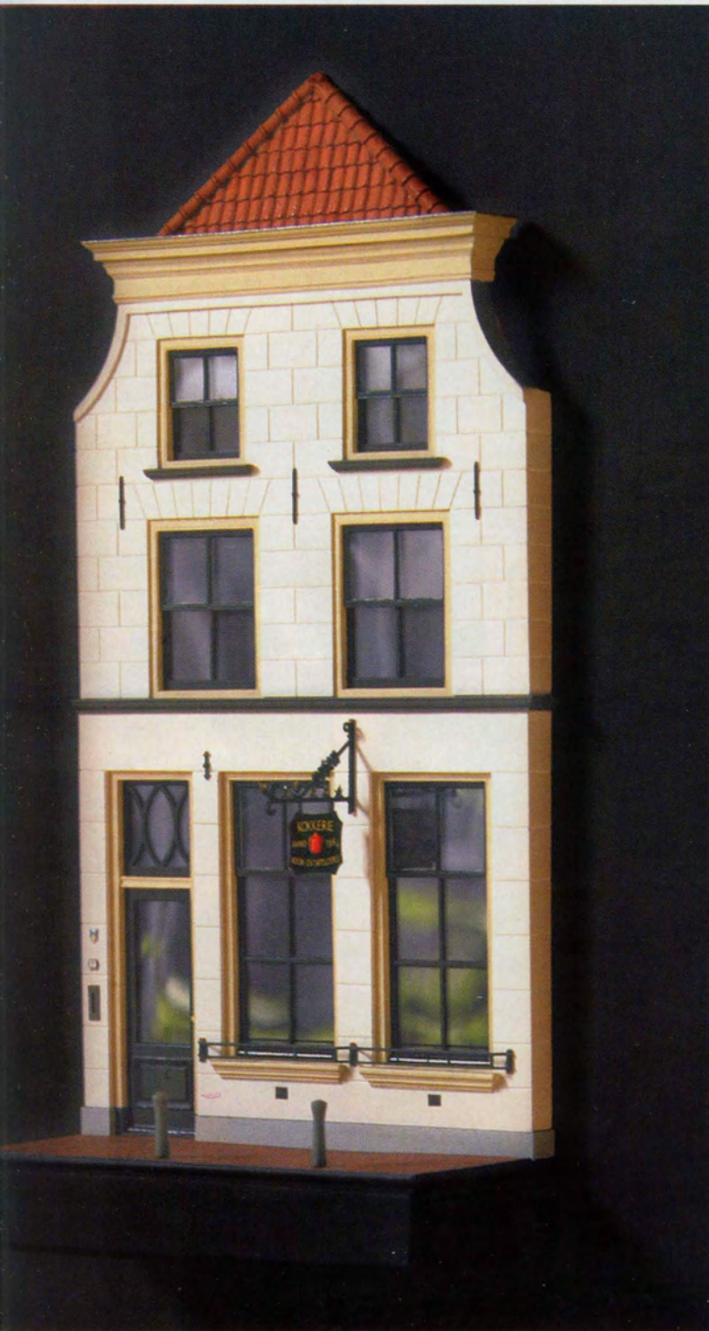
Een miniatuur van de gevel van 'De Kokkerie', een prachtige, antieke winkel in potten en pannen, in de oude binnenstad van Gouda.