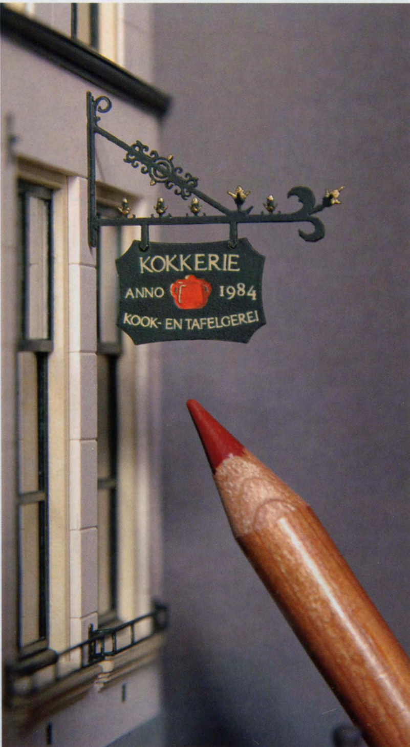
Het is dat de ware grootte herkenbaar wordt door het potlood, anders zou je zweren dat het een echt uithangbord was.