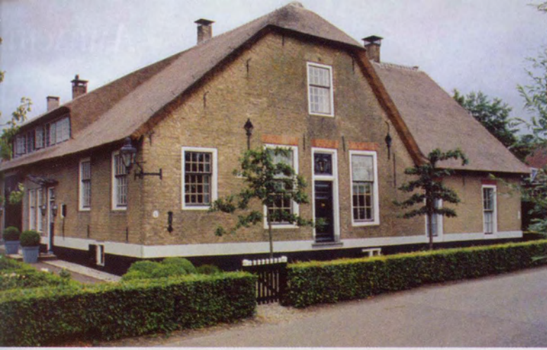
Gerards eerste grote opdracht was de monumentale hoeve 'De Rozenhof' in de Alblasterwaard.