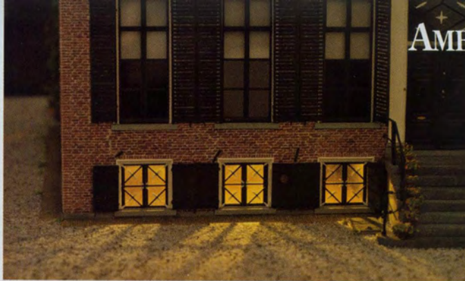
Met light emitting diodes (LED's) zijn allerlei realistisch ogende lichteffecten bereikbaar, zowel binnen als buitenshuis.

Ik vraag om vergelijkende foto's van de originele panden en Gerards miniaturen. Hij lacht even en zegt: 'Dat was een paar jaar geleden nog een gevoelig punt bij mij. Als je namelijk een foto van een mooi huis bekijkt, dan neem je tegelijkertijd de omgeving waar. De aankleding, zoals de tuin met bloemen en heesters, een vijver, de bomen eromheen, de oprijlaan, noem maar op. En mijn miniatuur stond dan in een soort "kale ruimte". Dat gaf op representa-